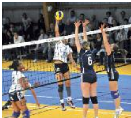
Vollet Club Niort